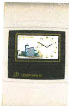
Moederuurwerk TEMPORA III

TEMPORA III is beschikbaar als wandmodel en bestaat uit een kunststofbehuizing, brandwerende classificatie UL94-V0 norm voor behuizingen en elektrische apparaten.