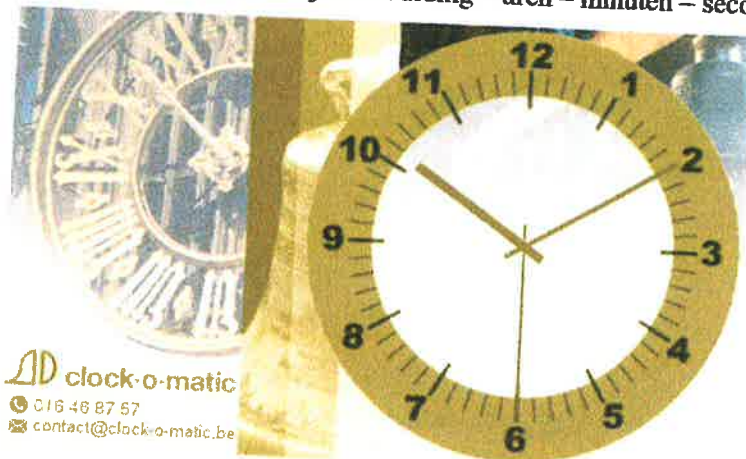
Voorbeeld van een rustscherm

Het rustscherm geeft de tijdsaanduiding – uren – minuten – seconden weer.